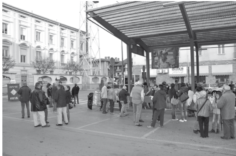
Castagnata Avis 2015, sempre un successo