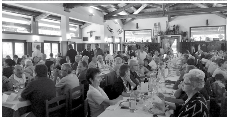
Il Pranzo Sociale 2015